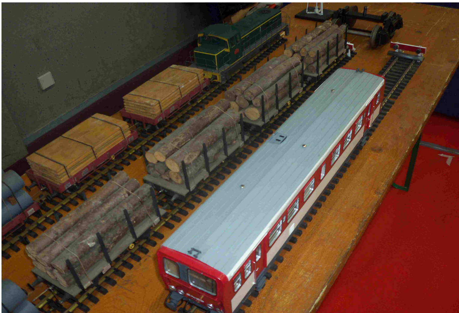
Echelle 1 1/32 (col privée).