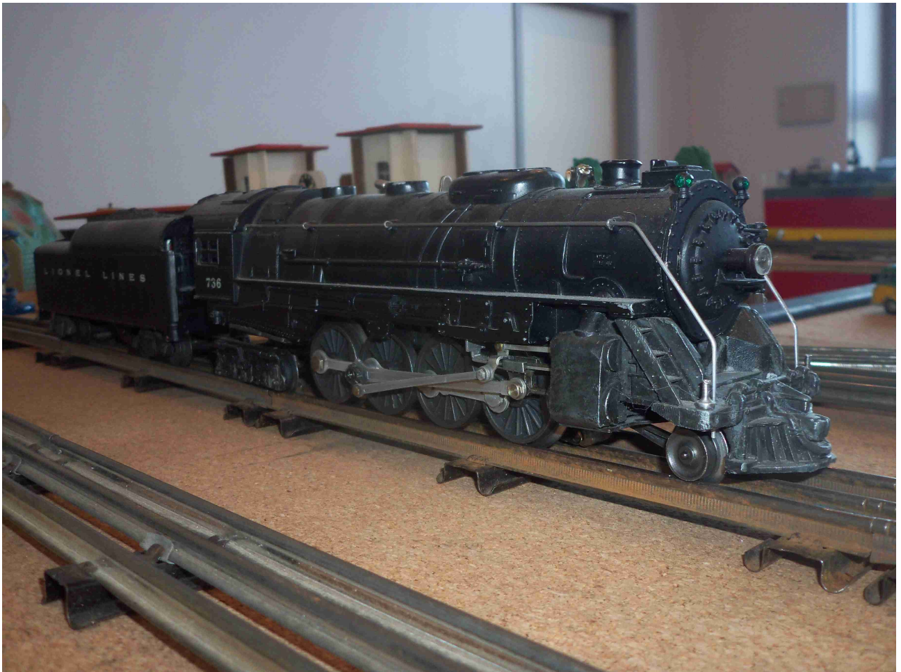
Lionel 142 (PB)