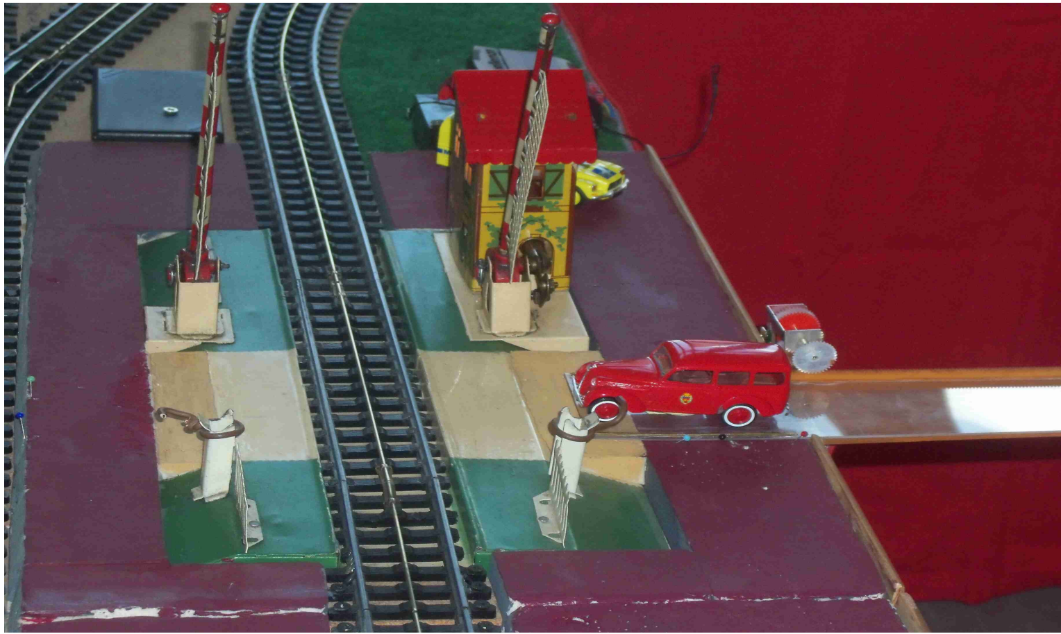
Nouveauté sur le réseau JEP; la voiture de pompier traverse la voie au PN.