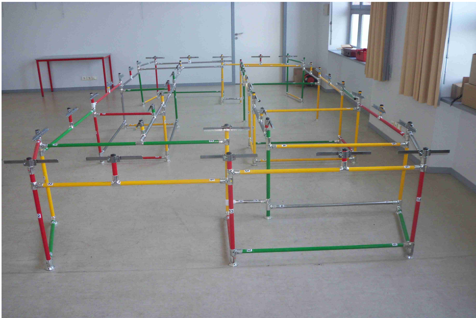
Le nouveau réseau tineplate : le support (5,40m X 2,40m).