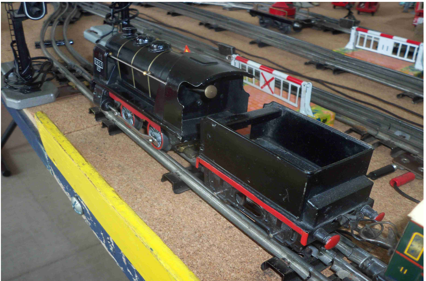
020 Hornby (col PR)