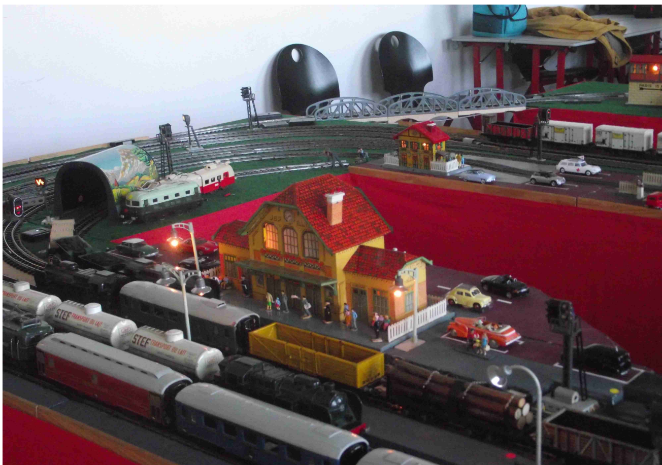
Réseau JEP (JPB)