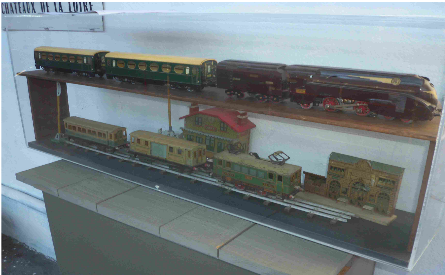
Flèche d'or Hornby, train Charles Rossignol et 030 vapeur vive.