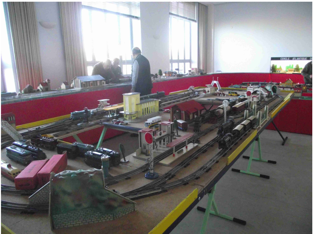
Réseau Hornby (PR)