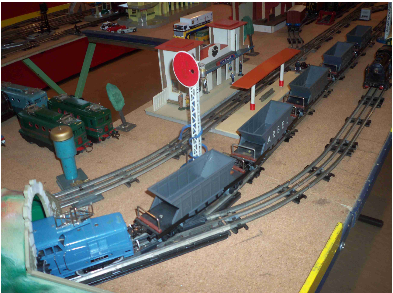
Train minier tracté par une BB 13000 Valenciennaise-Thionville. Hornby (PR)