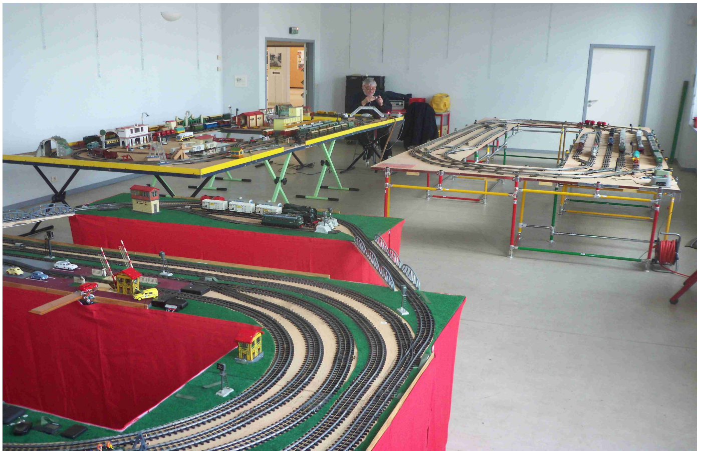
Les trois réseaux