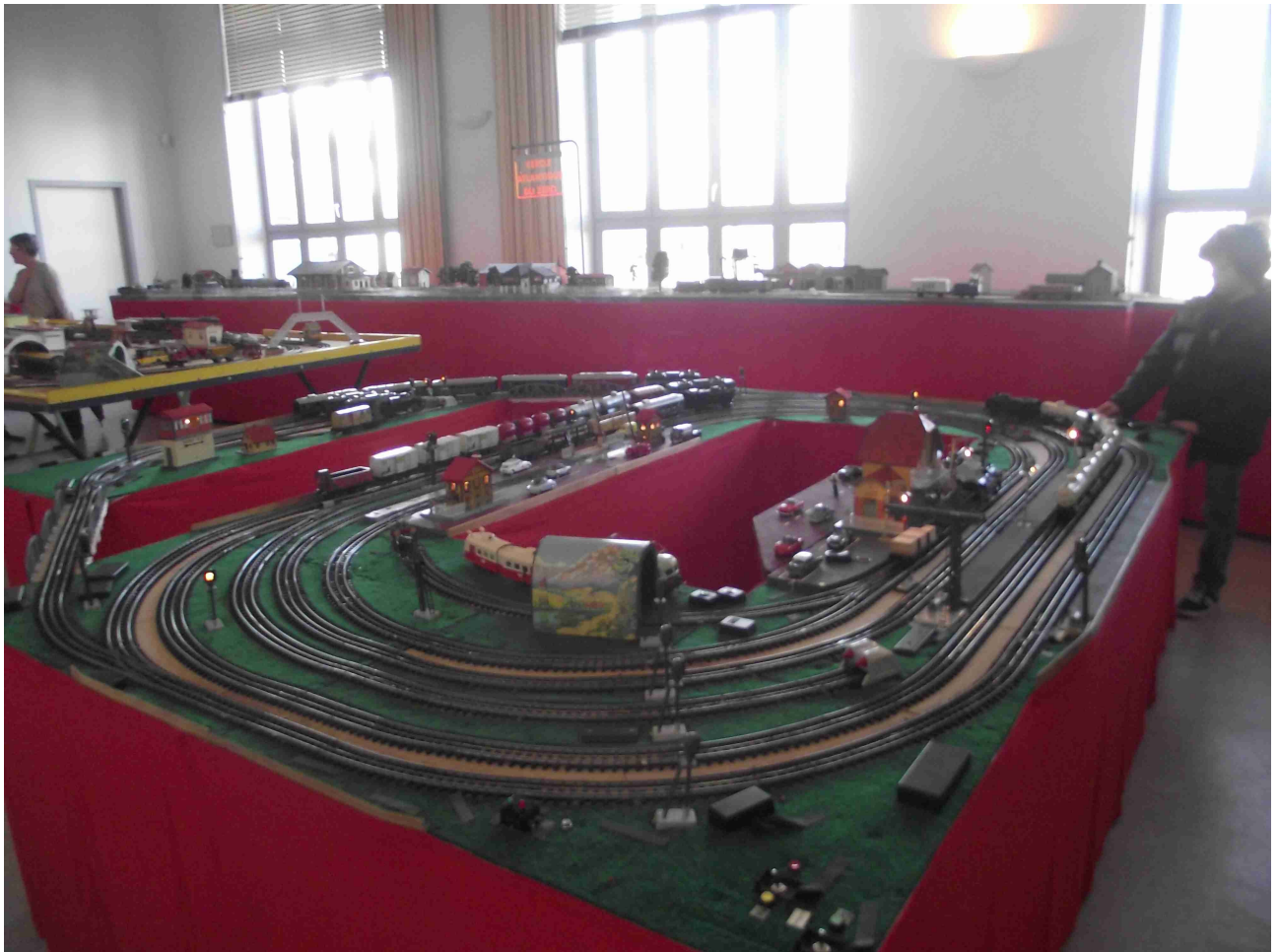
Réseau JEP (JPB)