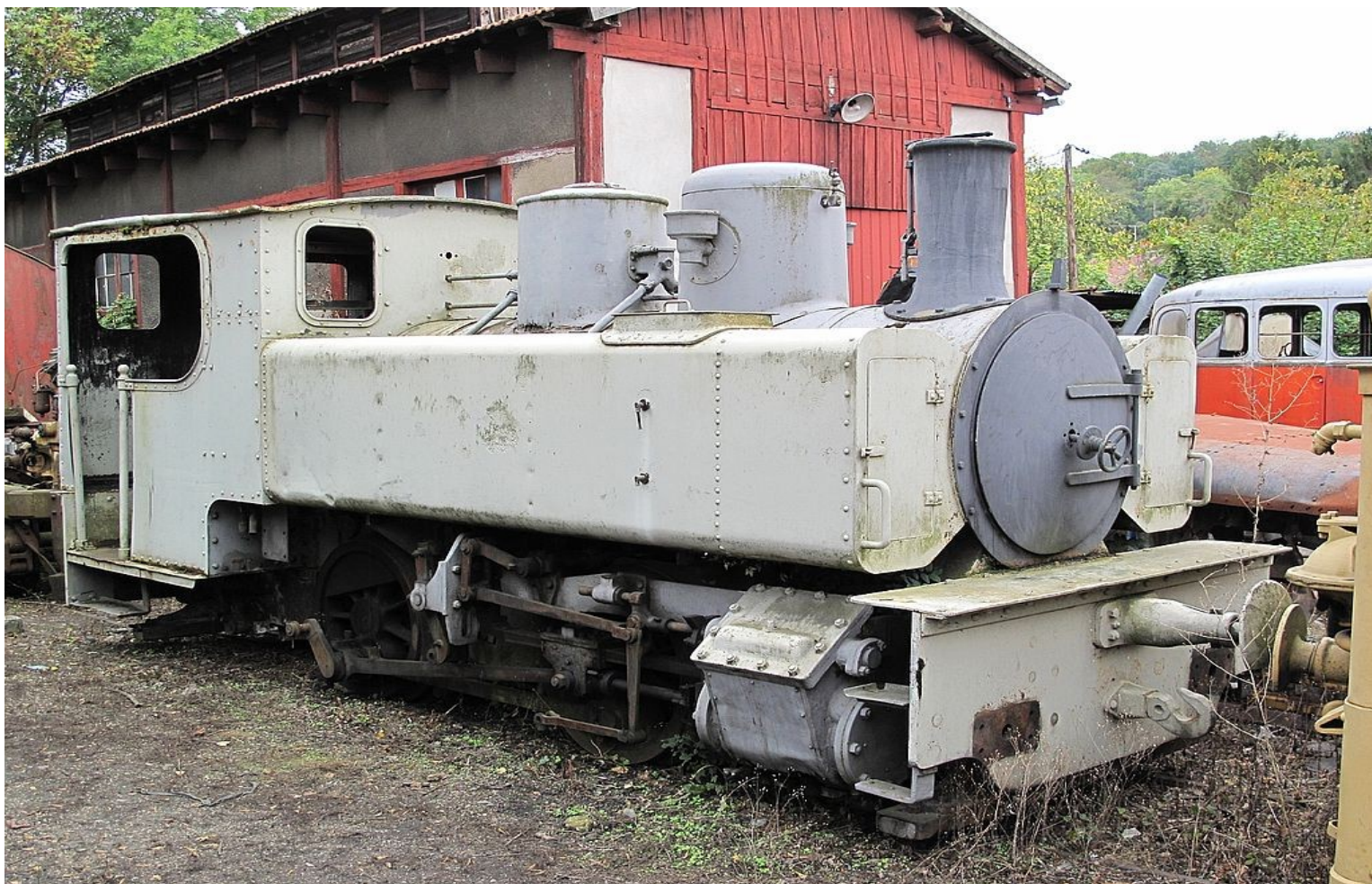
Grandeur nature en cours de restauration au MTVS (AG CNZ 2014) et en service à Guitres.