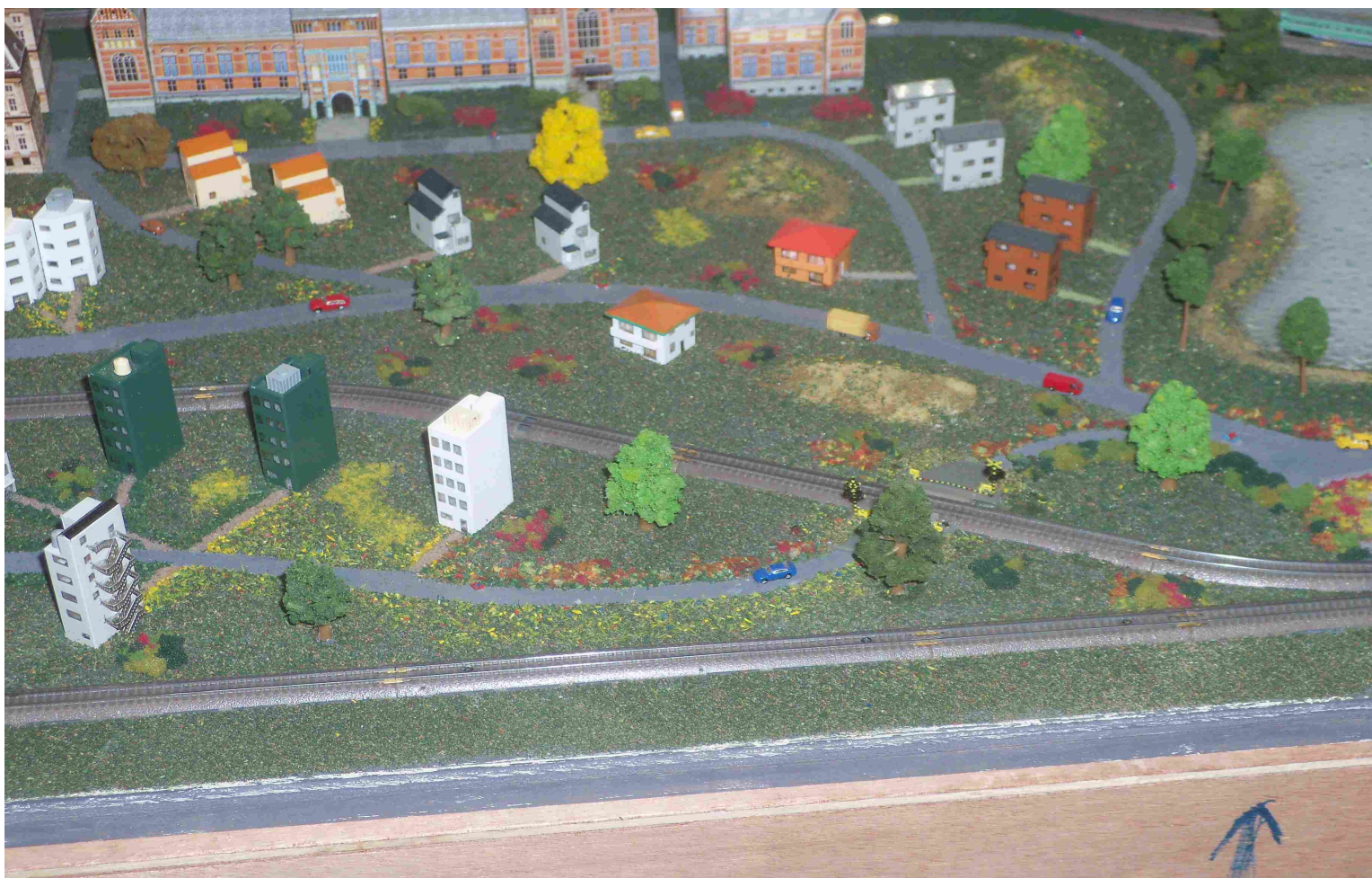
En haut, éch T 1/450 loupe fournie (col Rivière). En bas éch Z 1/220 et N 1/160 (col AMFI).