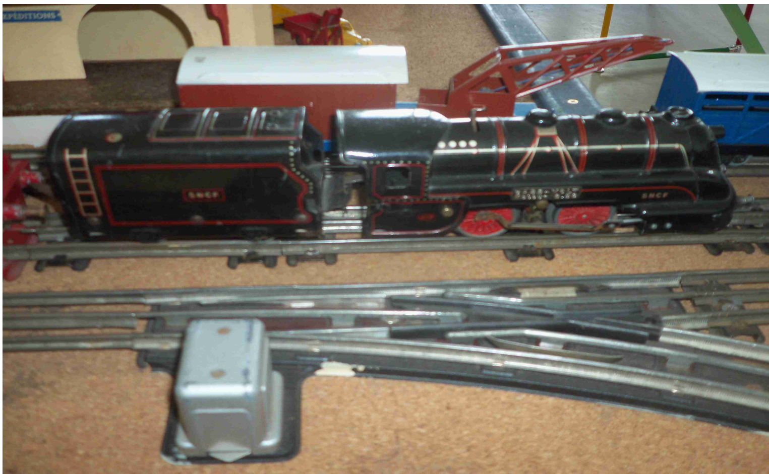
Version JEP (Col PR)