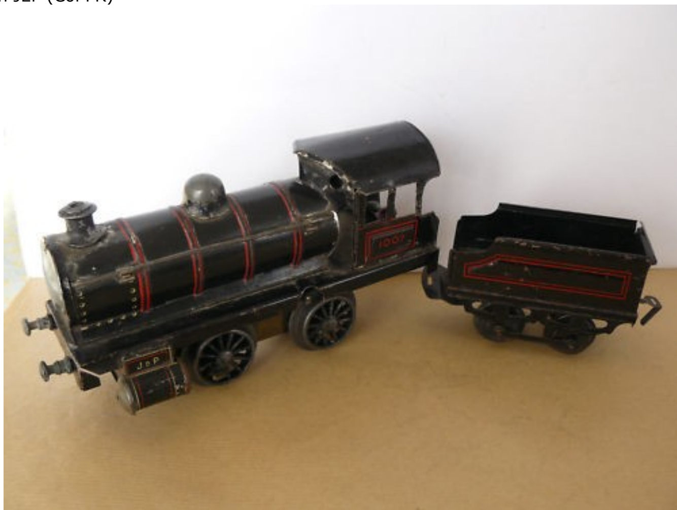
Version JdP à priori mécanique (Col ?)