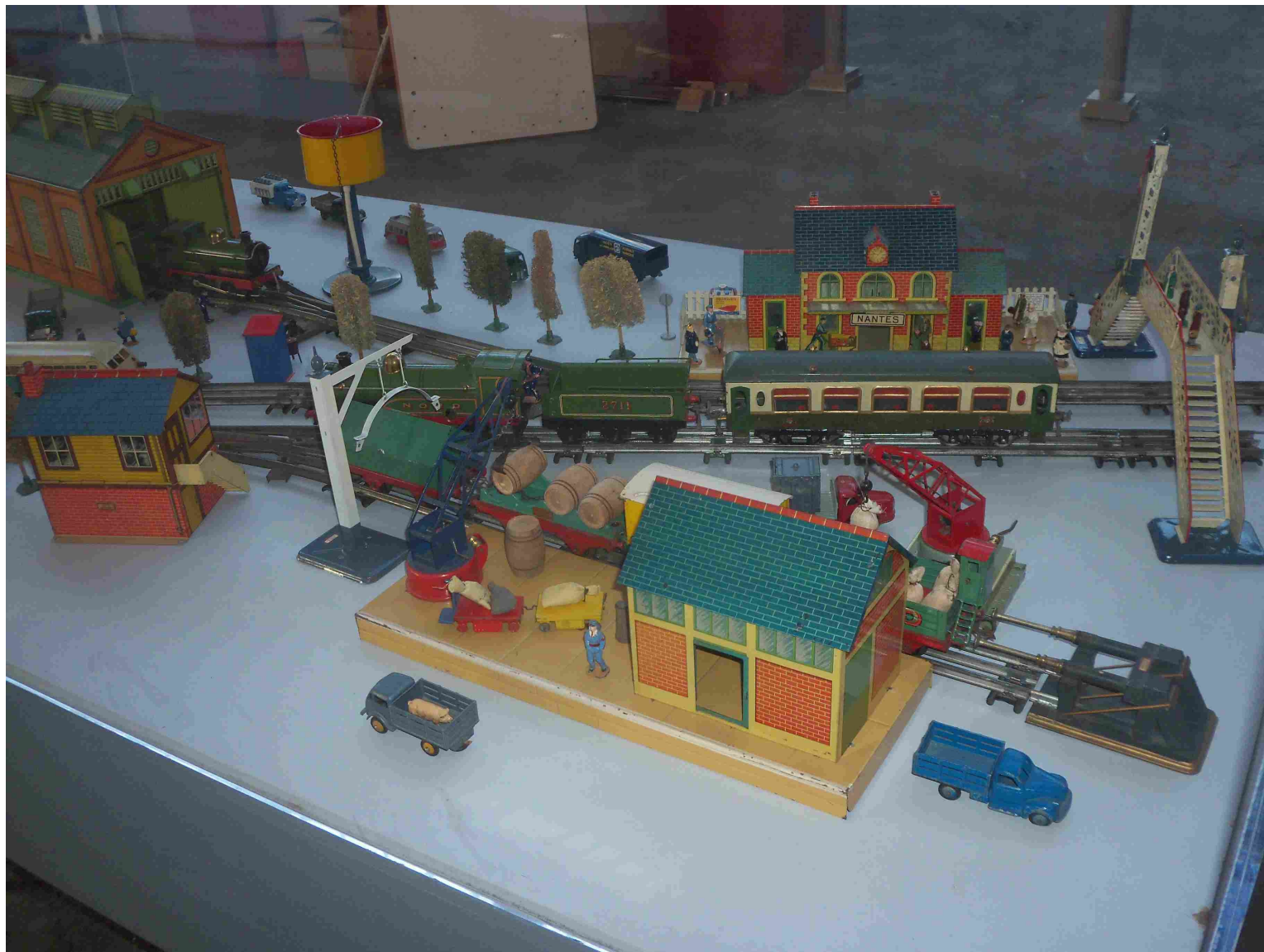
Hornby avant guerre.

Présentation de trains jouets lors des journées du patrimoine du Conservatoire des Industries de l'Estuaire de la Loire (CIEL) dans l'atelier de lithographie d'Arcelor-Mittal anciennement Carnaud Basse-Indre.