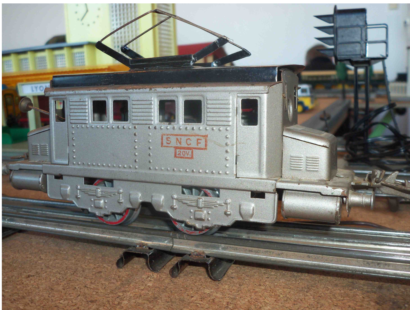
PO ? Boite à sel ? Hornby (PB)