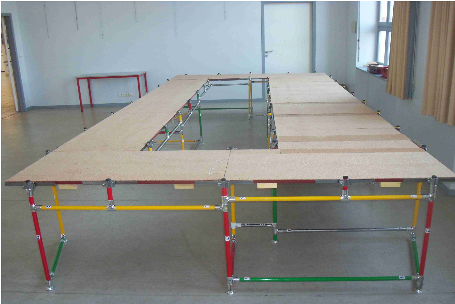
La plateforme provisoire et une première ébauche de circuit.