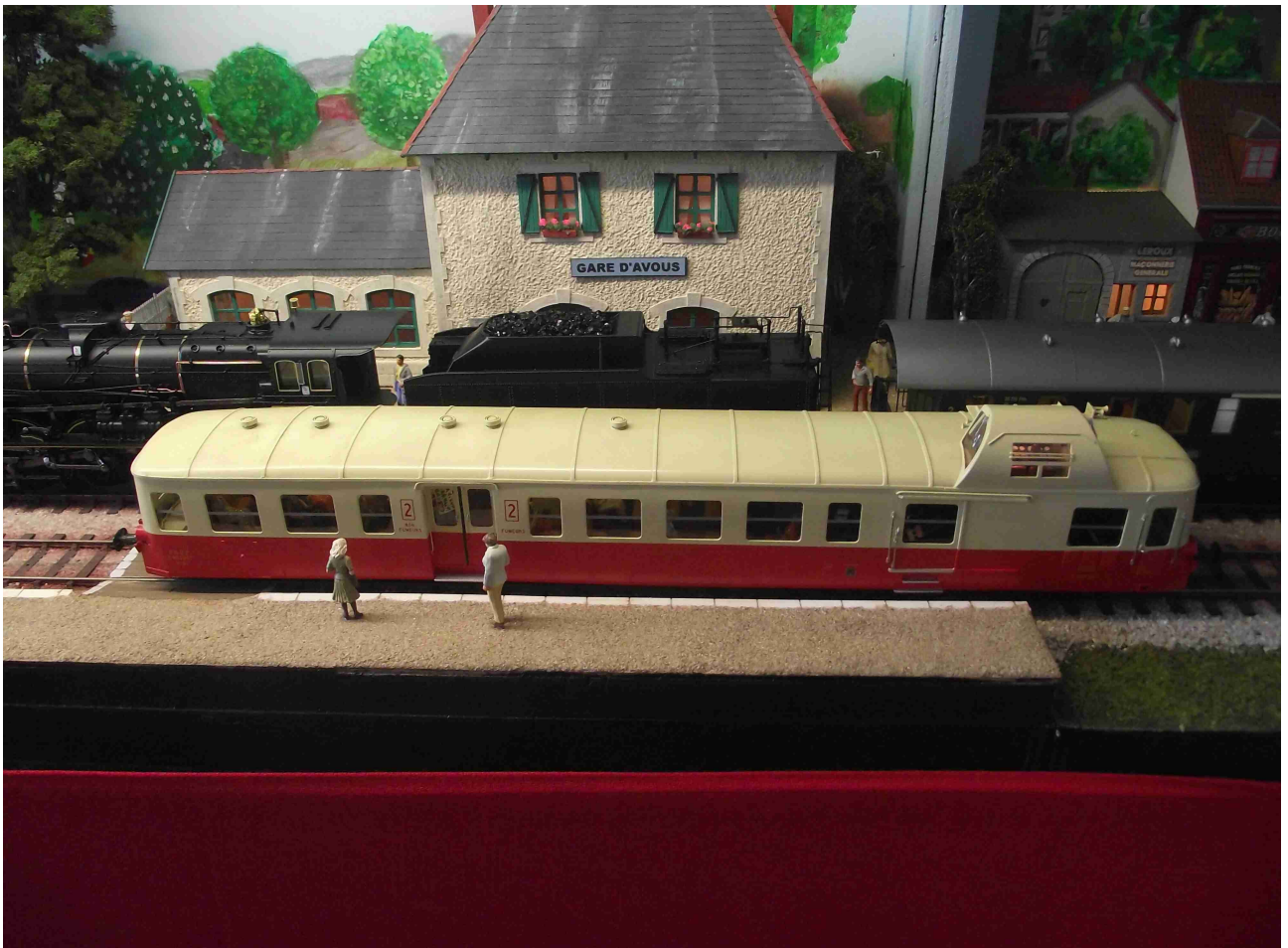
Picasso dans un module 4000 (CB)