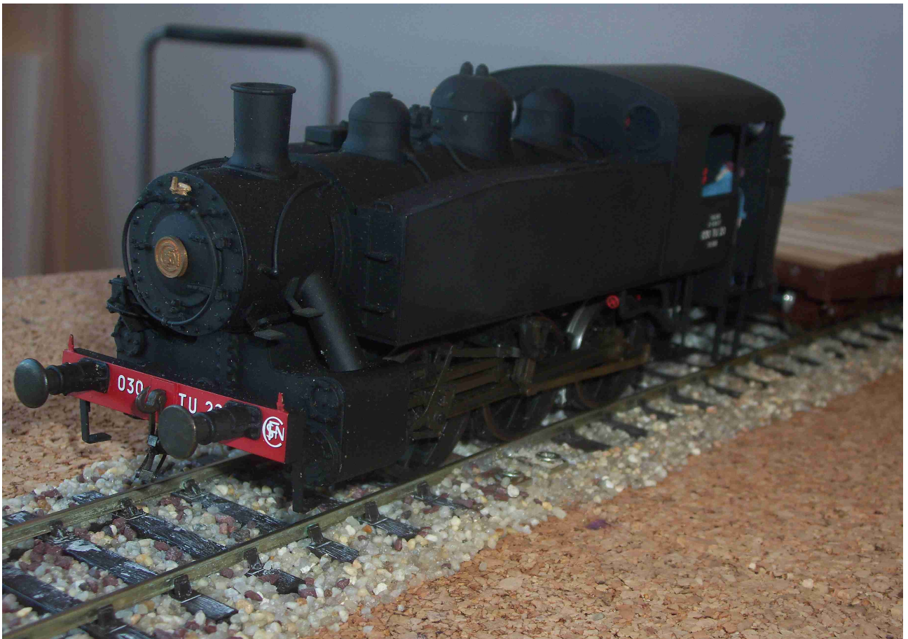
030 TU (?)