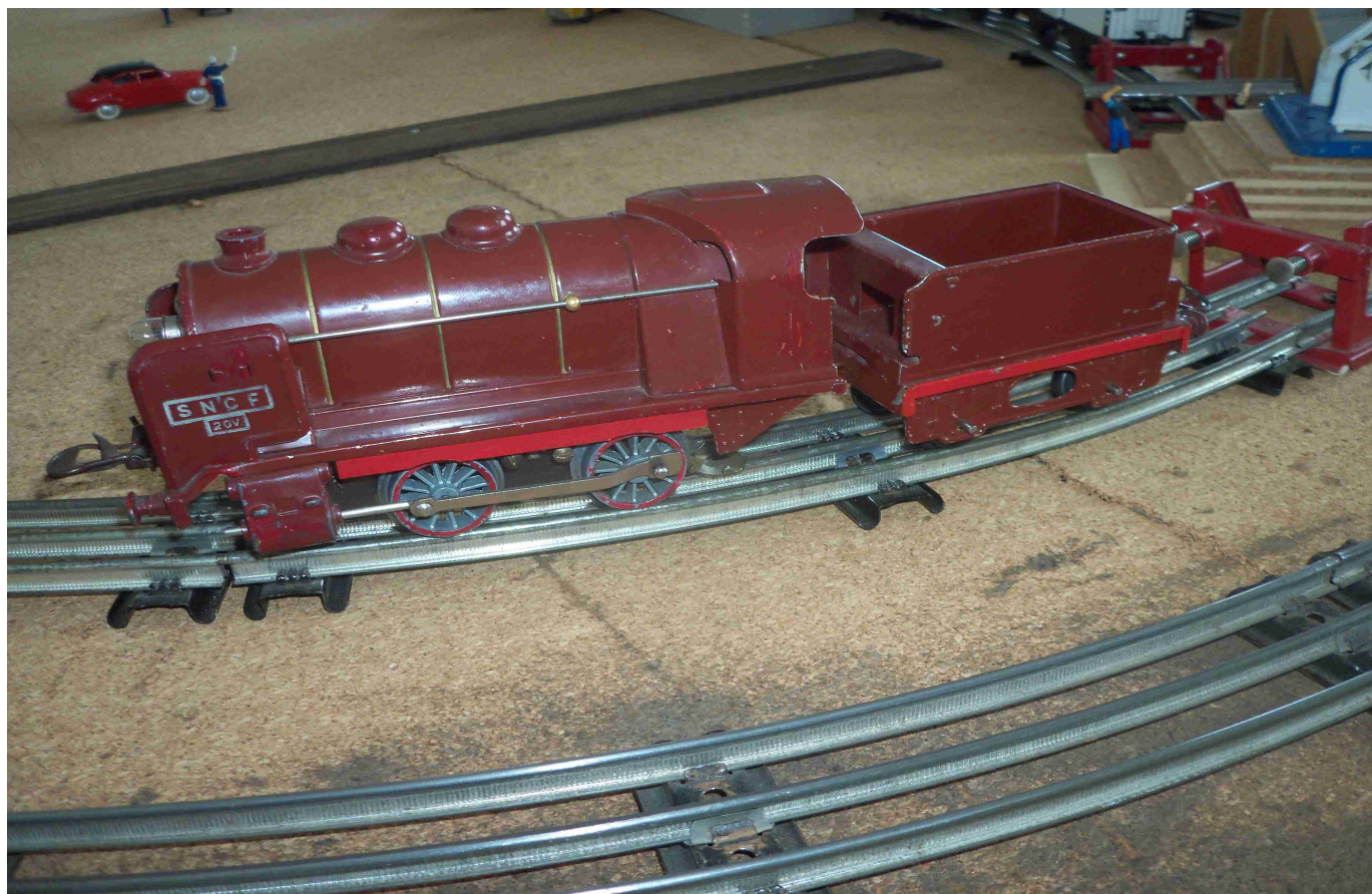
La même version rouille (col PR)