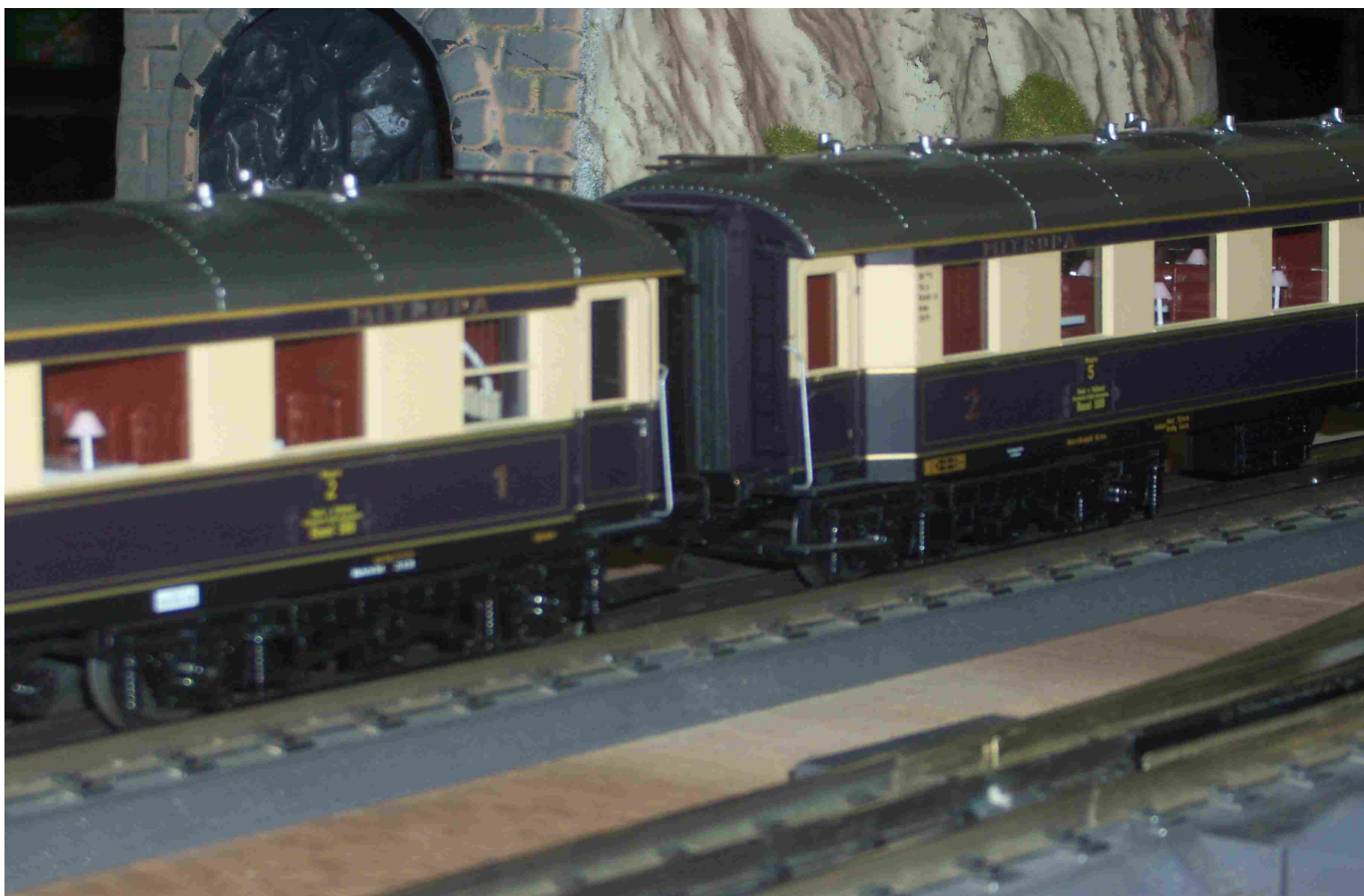
Trois dernières photos, rame MTH Orient-Express tractionnée par une 231 (col AMFI).